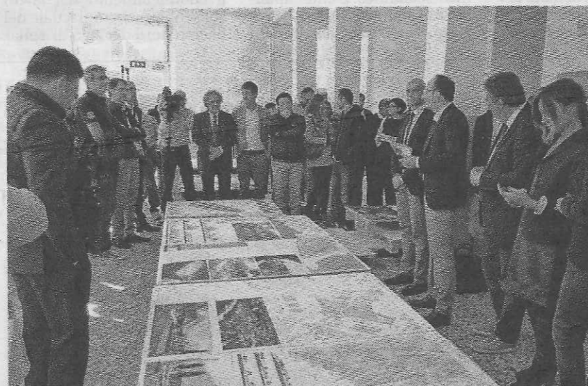
La premiazione e presentazione dei progetti per il concorso di idee per la Miralago

Ieri la presentazione dei 31 progetti, ora esposti nelle sale del compendio: i visitatori potranno esprimere preferenze e commenti tramite due pc