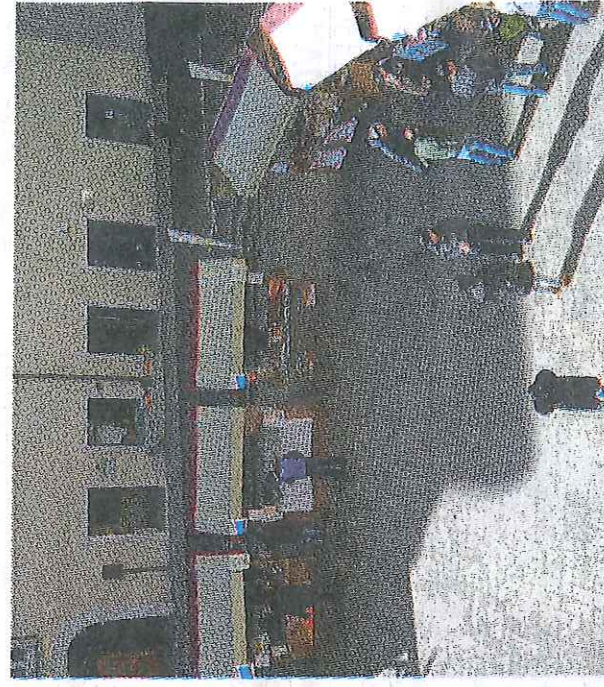
Le bancarelle con i prodotti tipici monesi e trentini ieri in piazza

visitatori in Trentino, rendendola attrattiva la nostra peculiarità». Soddisfatto ed orgoglioso il commento del sindaco Flaim: «Abbiamo voluto portare Expo in Trentino, e in particolare in valle di Non, perché crediamo che sia un'opportunità di crescita anche per il nostro territorio e un'opportunità per le aziende che al meglio rappresentano la nostra terra. Sono grata ad Anci per averci dato l'opportunità di organizzare l'unica data trentina del loro