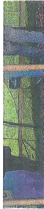
Il poligono per il tiro a segno sulla Predaia

...una partecipazione superiore alle attese e che dimostra il grande interesse che c'è in valle per questo sport», è il commento degli organizzatori. Ad intere-